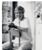
Lili Scratchy Seiten 54/62

Aquarelle sind das Herzstück der Arbeit der Londoner Künstlerin Alex Simpson. Sie lädt das Ungezwungene und Spontane dazu ein, ihre feingliedrigen Figuren in verwässerte Tinte ausbluten zu lassen. Für diese Ausgabe hat sie eindrucksvoll Siegfried diesen Weg gehen lassen, als er plötzlich die Sprache des Vögleins verstehen kann, und den mächtigen Moment, als der Rhein über die Ufer tritt und die Rheintöchter den Ring zurückgewinnen. Ab S. 44.